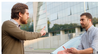
Detector de agresión