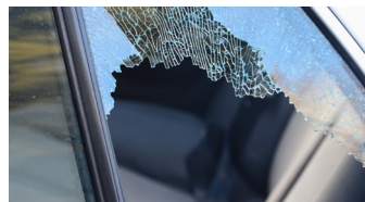
Detector para ruptura de cristales