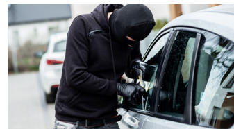
Detector de alarma para coche