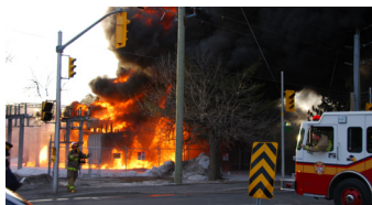
Detector de explosiones